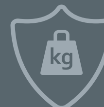
Sehr hoher Härtegrad