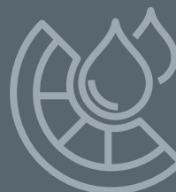
Säure- & Feuchtigkeitsbeständig